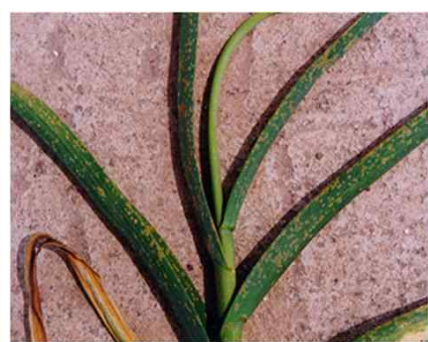
< 녹병 >