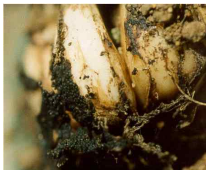
< 흑색썩음균핵병 >