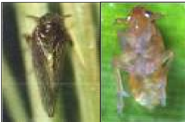
벼멸구 성충(좌) 및 약충(우)