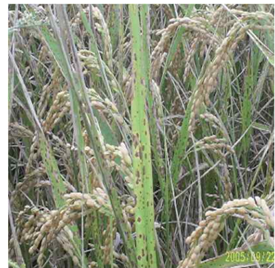
< 깨씨무늬병 증상 >