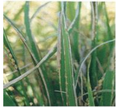
< 벼 흰잎마름병 증상 >