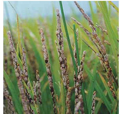
< 세균벼알마름병 증상 >