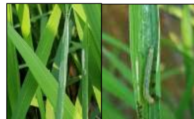
【흑명나방 피해(좌) 및 유충(우)】