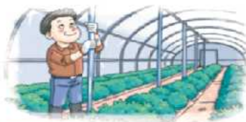
노후화된 시설 등은 보강지주 설치