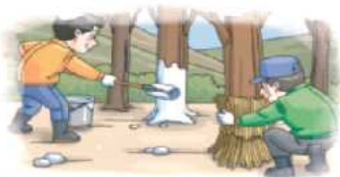
과수 주간부 벗짚파복 또는 수성페인트 칠하기