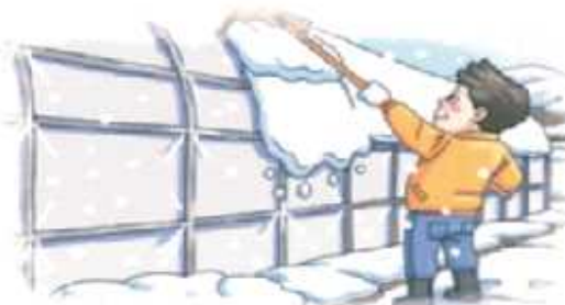
하우스 위 눈 쓸어내기