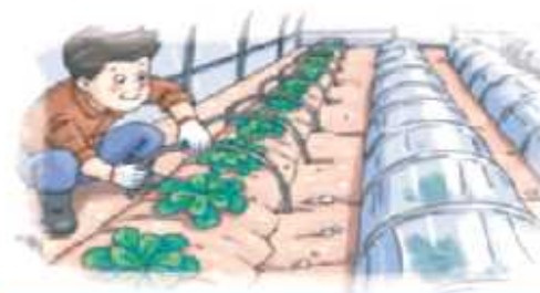
시설파손, 저온피해 우려시 소형터널 설치