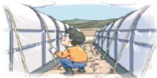
시설하우스 고정끈 설치 및 보강