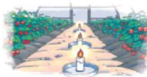
정전, 온풍기 고장시 양초·알코올 등 응급조치

※ 응급대책 활용시 화재 위험성 및 산소부족으로 불이 꺼질 수 있으므로 세심한 관리 필요