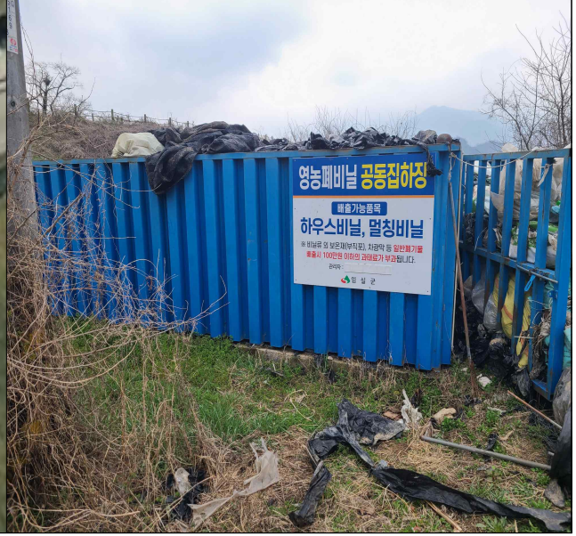
공동집하장 현장 사진