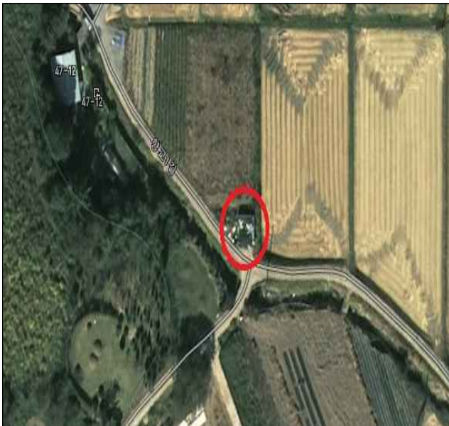
공동집하장 지도 이미지