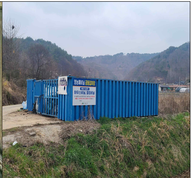
공동집하장 현장 사진