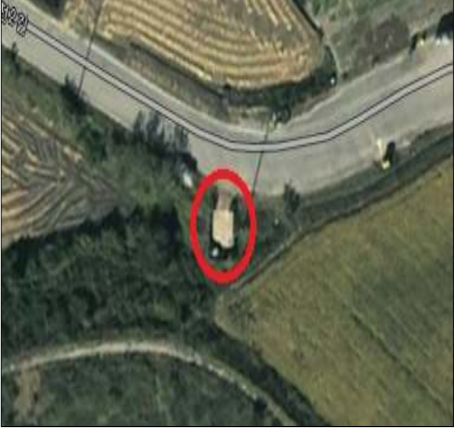
공동집하장 지도 이미지