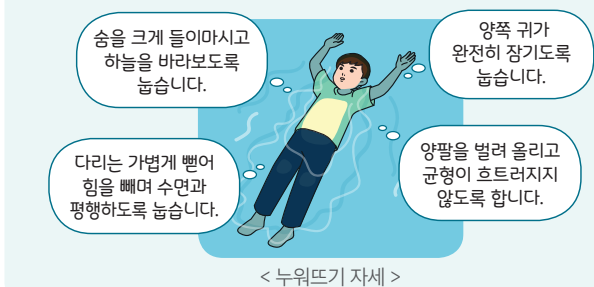
< 누워뜨기 자세 >