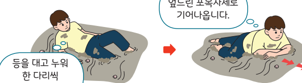
< 갯벌에 무릎이 빠진 경우 탈출 요령 >