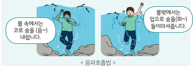
< 음파호흡법 >