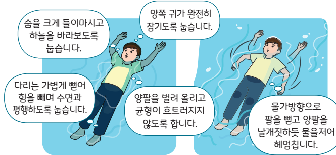
< 누워뜨기 자세 >