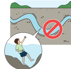
< 갯골에 접근 금지 >