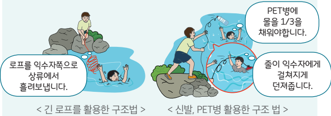
< 긴 로프를 활용한 구조법 > < 신발, PET병 활용한 구조법 >