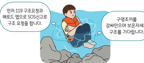
< 구조 전까지 체온유지(보온) 자세 >