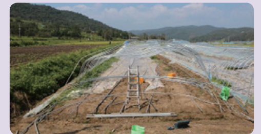
[일반 피해 하우스]