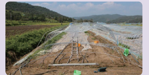
[일반 피해 하우스]