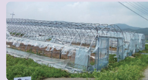
[비닐 사전 제거 하우스]