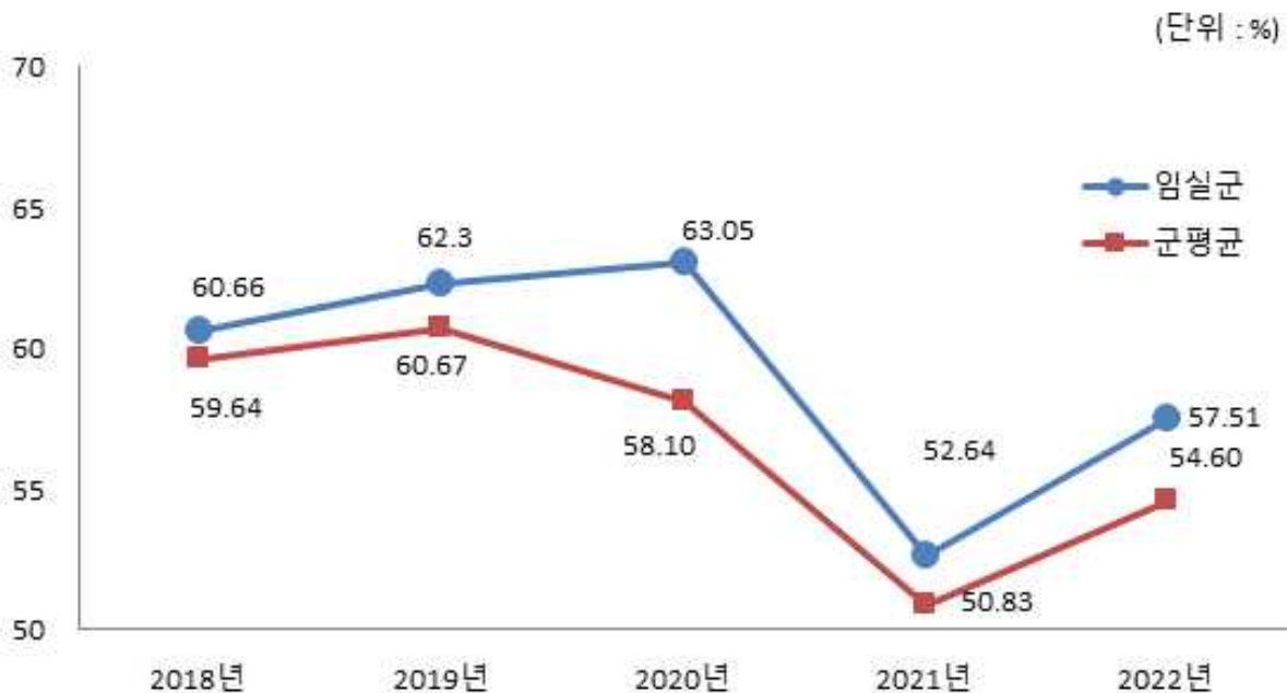
유형 지방자치단체와 재정자주도 비교