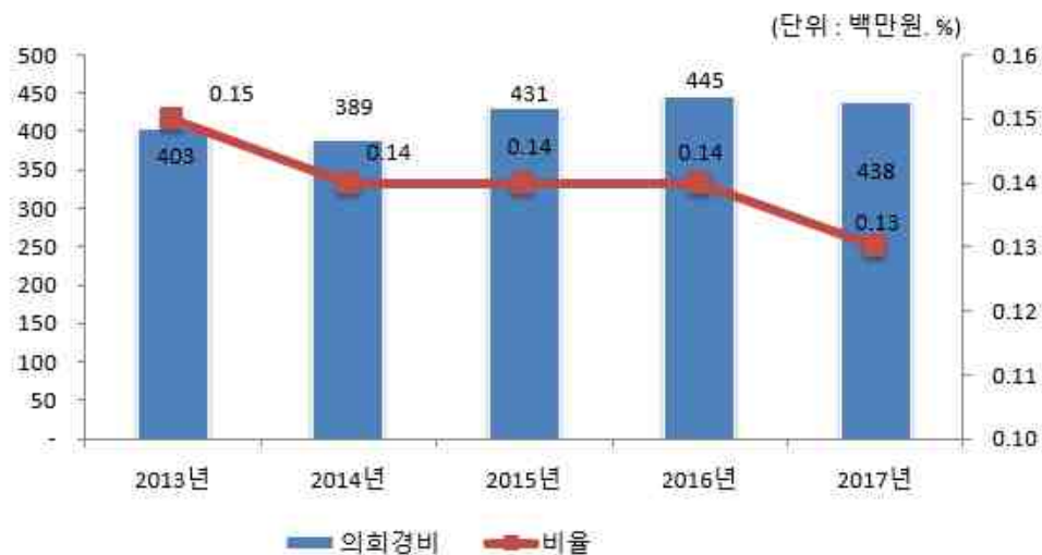
의회경비 연도별 집행액 및 비율 변화