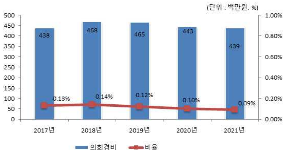
의회경비 연도별 집행액 및 비율 변화