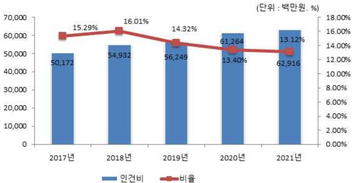
인건비 연도별 변화